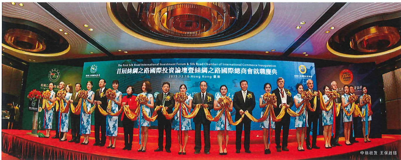
全国政协委员、丝绸之路国际总商会主席、中国国际商会副会长吕建中与丝绸之路国际总商会各成员商会领导共同剪彩，庆祝丝路国际总商会成立

梁振英致辞表示，香港拥有“一国两制”的优势，兼具中华文化与及国际视野，其“超级联系人”的角色，将在“一带一路”建设中发挥更重要的投资、中介及支援作用。他说，香港是国际金融、商贸枢纽，稳