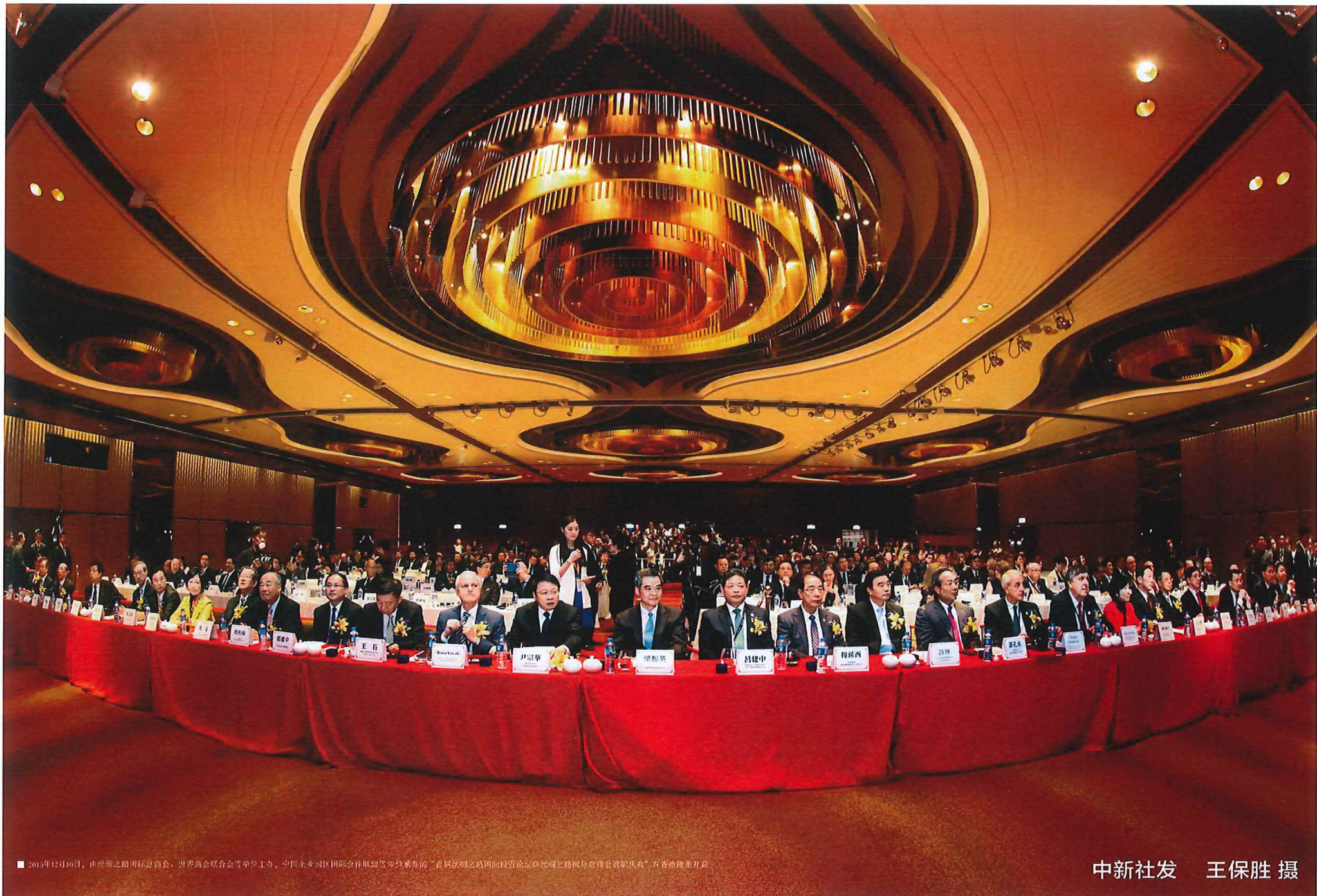
■ 2015年12月10日，由丝绸之路国际总商会、世界商会联合会等单位主办，中国北亚地区国际商会联盟等单位承办的“首届丝绸之路国际投资论坛暨丝绸之路国际总商会就职庆典”在香港隆重开幕