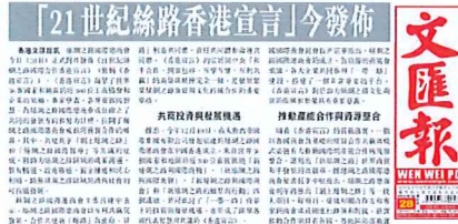
2015年12月28日《文汇报》刊发新闻

新华网香港12月9日电(记者何宇宇)“首届丝绸之路国际投资论坛暨丝绸之路国际总商会就职庆典”将于10日在香港举行。9日,丝绸之路国际总商会召开新闻发布会,高度评价“一带一路”战略,希望总商会能为战略的建设和发展贡献力量。