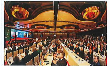
2015年12月15日《文汇报》刊发新闻

【香港专讯】十二月十日,由丝绸之路国际总商会、世界商会联合会等共同主办,中国国际贸易促进委员会承办的“首届丝绸之路国际投资论坛暨丝绸之路国际总商会就职庆典”在香港会议展览中心举行。行政长官梁振英、国务院副总理汪洋、香港特别行政区行政长官梁振英、世界商会联合会主席彼得·朱腊克、中国国际贸易促进委员会会长夏春霖等出席了活动。