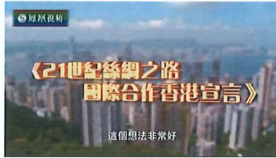
2016年2月16日凤凰卫视《丝路文明》——《国际合作香港宣言》