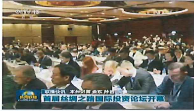
2015年12月10日中央电视台《新闻联播》——《首届丝绸之路国际投资论坛开幕》