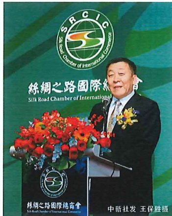
■ 中华文化促进会主席王石致辞，希望藉商道推动和传递丝绸之路文明

王石表示，丝绸之路的发展，自古以来都是商贸和文化的发展。这是经济、商贸、文化的首次大面积交融，希望藉商道推动和传递丝绸之路文明。