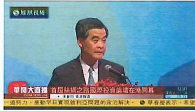
2015年12月10日凤凰卫视《华闻大直播》——《首届丝绸之路国际投资论坛在港开幕》