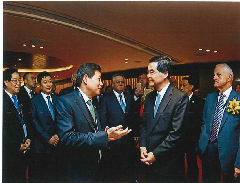
■ 香港特区政府长官梁振英出席开幕式并与全国政协委员、丝绸之路国际总商会主席、中国国际贸易会长吕建中亲切交谈

我们相信，随着《香港宣言》的贯彻落实和各项行动计划的全面推进，一个以各国商会为基础的经贸合作共赢新模式必将有力推动国际产能合作与资源整合，描绘出“新丝绸之路”世界商贸和平发展的新画卷。