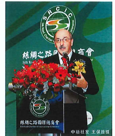
■ 丝绸之路国际总商会执行主席让·卡思埃主持开幕式

丝路基金特别代表吴松致辞表示：丝绸之路国际总商会是国际化的商务平台。它不仅仅要深化全球贸易的参与度，还必须提升参与的进度和效率，发挥其“一带一路”+新丝绸之路“+”的模式，加进一切有利于发展、互惠互利的资源。今后，我们要发展具体的项目和业务，使我们的企业“走出去”、“走进来”、“走上去”。丝路基金正在寻找一个有效对接、融合的平台，使投、融资在融合的效率方面能取得预期的效果，这也正是丝绸之路国际总商会要解决的问题。