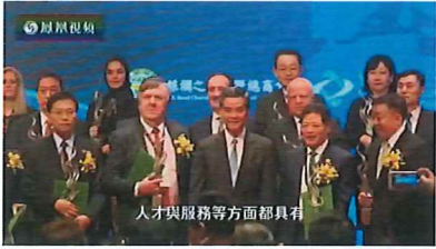
2015年12月10日凤凰卫视《丝路文明》——《丝绸之路国际总商会》