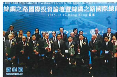
12月10日,与会嘉宾合影。当日,“首届丝绸之路国际投资论坛暨丝绸之路国际总商会就职庆典”在香港举行,来自丝绸之路沿线36个国家的工商协会会长、商界领袖齐聚一堂,共同探讨“一带一路”背景下的投资与发展机遇。